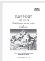
RAPPORT Mail-carrying (32 pages) 9188008614