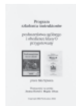
Program szkolenia instruktorów PO + Kl 0