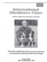
DVD International Obedience Class