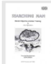
SEARCHING MAN (48 pages) 9188008000