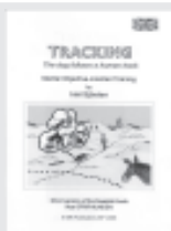
TRACKING (32 pages) 9188008665