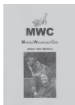
MWC - Metoda wizualizacji celu