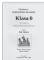
9188008738 Broszura Klasa 0 (PL regulaminy)