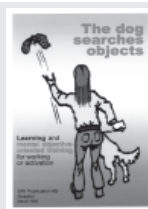
SEARCHING OBJECTS (16 pages) 9188008665