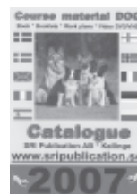
Product catalogue is sent free