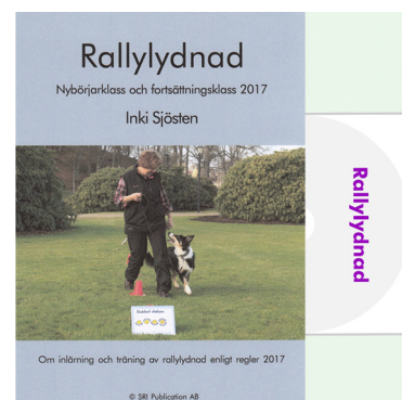
Häfte 150kr med dvd fr 2013 170kr